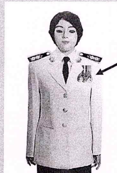
เครื่องแบบเต็มยศและครึ่งยศ

ห้อยกับแพรแถบแบบบุรุษ ประดับที่อกเสื้อเบื้องซ้าย ร่วมกับเหรียญราชอิสริยาภรณ์ และเหรียญที่พระราชทาน เป็นที่ระลึกในโอกาสต่าง ๆ