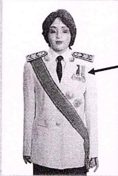
เครื่องแบบเต็มยศ

ประดับดารา ดวงตรา และสวมสายสะพายเช่นเดิม