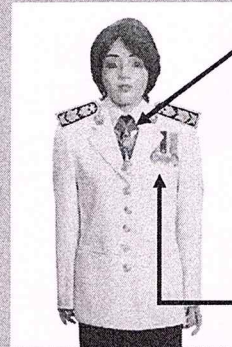
เครื่องแบบเต็มยศและครึ่งยศ (ประดับเครื่องราชอิสริยาภรณ์เหมือนกัน)

เช่น ต.ช., ต.ม. (เดิมประดับหน้าบ่าล้อมี)