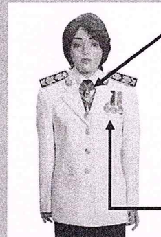
เครื่องแบบเต็มยศและครึ่งยศ (ประดับเครื่องราชอิสริยาภรณ์เหมือนกัน)

เช่น ต.ช., ต.ม. (เดิมประดับหน้าบ่าเสื้อ)