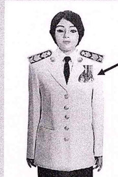
เครื่องแบบเต็มยศและครึ่งยศ

ประดับแพรแถบ เหรียญที่พระราชทานเป็นที่ระลึก ในโอกาสต่าง ๆ แบบบุรุษ ที่อกเสื้อเบื้องซ้าย