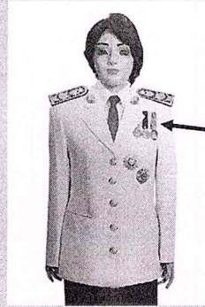
เครื่องแบบครึ่งยศ

เหรียญราชอิสริยาภรณ์ เช่นเหรียญที่พระราชทาน เป็นที่ระลึกในโอกาสต่าง ๆ ให้ประดับโดยใช้แพรแถบ แบบบุรุษ