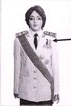
เครื่องแบบเต็มยศ

ประดับดารา ดวงตรา และสวมสายสะพายเช่นเดิม