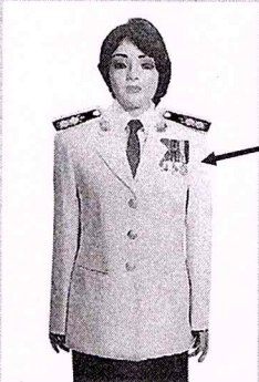
เครื่องแบบเต็มยศและครึ่งยศ (ประดับเครื่องราชอิสริยาภรณ์เหมือนกัน)

เช่น จ.ช., จ.ม., บ.ช., บ.ม., ร.ท.ช., ร.ท.ม., ร.จ.ช., ร.จ.ม.