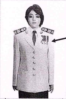
เครื่องแบบเต็มยศและครึ่งยศ (ประดับเครื่องราชอิสริยาภรณ์เหมือนกัน)

เช่น จ.ช., จ.ม., บ.ช., บ.ม., ร.ท.ช., ร.ท.ม., ร.จ.ช., ร.จ.ม.