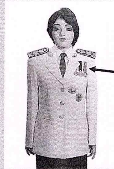
เครื่องแบบครึ่งยศ

เหรียญราชอิสริยาภรณ์ เช่น เหรียญจักรพรรดิมาลา เหรียญที่พระราชทานเป็นที่ระลึก ในโอกาสต่าง ๆ ให้ประดับโดยใช้แพรแถบ แบบบุรุษ