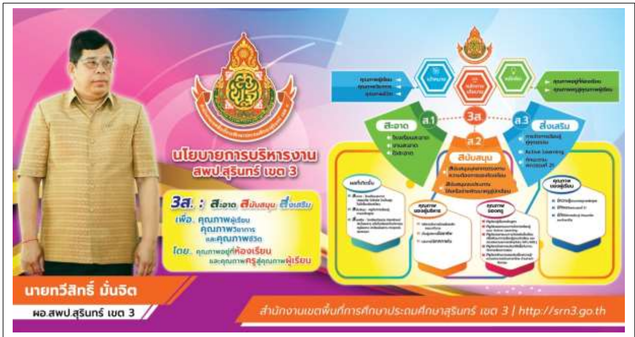
ภาพ 4 : แสดงนโยบายการบริหารงาน สำนักงานเขตพื้นที่การศึกษาประถมศึกษาสุรินทร์ เขต 3

“สะอาด สนับสนุน ส่งเสริม” คือ หลักการในการบริหารตามนโยบาย 3 ส ของสำนักงานเขต พื้นที่การศึกษาประถมศึกษาสุรินทร์ เขต 3 ที่คาดหวังว่าทุกภาคส่วน ผู้บริหารการศึกษา ผู้บริหาร สถานศึกษา ครูและบุคลากรทางการศึกษา จะได้ร่วมด้วยช่วยกันก่อให้เกิดประโยชน์สูงสุดกับผู้เรียนต่อไป