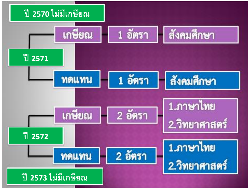
แบบ 5 : สรุปจำนวนครูเกษียณและการทดแทน

*ไม่ต้องกรอกข้อมูล* ข้อมูลจะทำการเชื่อมโยงมาจากแบบ 3 และ แบบ 4