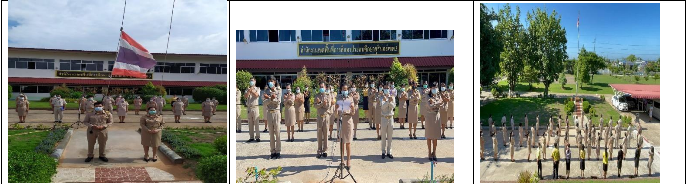
กิจกรรมเข้าแถวเคารพธงชาติ สวดมนต์ไหว้พระ กล่าวคำปฏิญาณเขตสุจริต และผู้บริหารพบบุคลากร เจ้าหน้าที่

2. กิจกรรมการเข้าแถวเคารพธงชาติ สวดมนต์ไหว้พระ กล่าวคำปฏิญาณเขตสุจริต และผู้บริหารพบบุคลากร เจ้าหน้าที่ในสำนักงานเขตพื้นที่การศึกษาประถมศึกษาสุรินทร์ เขต ๓ ทุกวันจันทร์ และ วันศุกร์ เพื่อแจ้งข้อมูลข่าวสาร ผลการปฏิบัติงานในรอบสัปดาห์ที่ผ่านมา และ แจ้งกิจกรรมที่ดำเนินงานในสัปดาห์