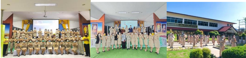
วันอังคาร ชุดพื้นเมือง ผ้าไทย ผ้าลายขอ